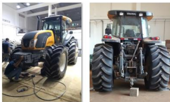
Figura 1. Trator Valtra BT210 equipado com o conjunto pneus.

As áreas de contato do pneu e da barra foram analisadas por teste de médias Tukey ao nível de 5% de probabilidade.